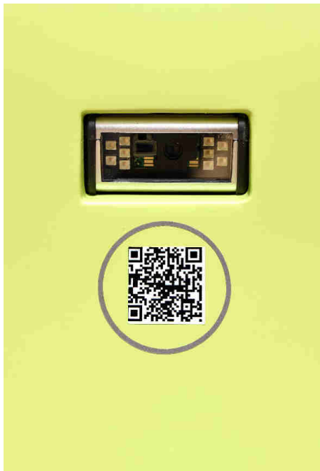
Lector de códigos para tarjetas virtuales, bonos promocionales, devoluciones...