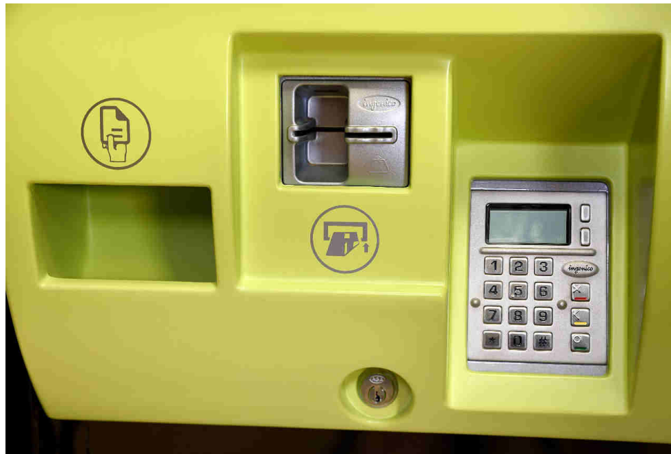
Gaveta de recogida para documentos impresos